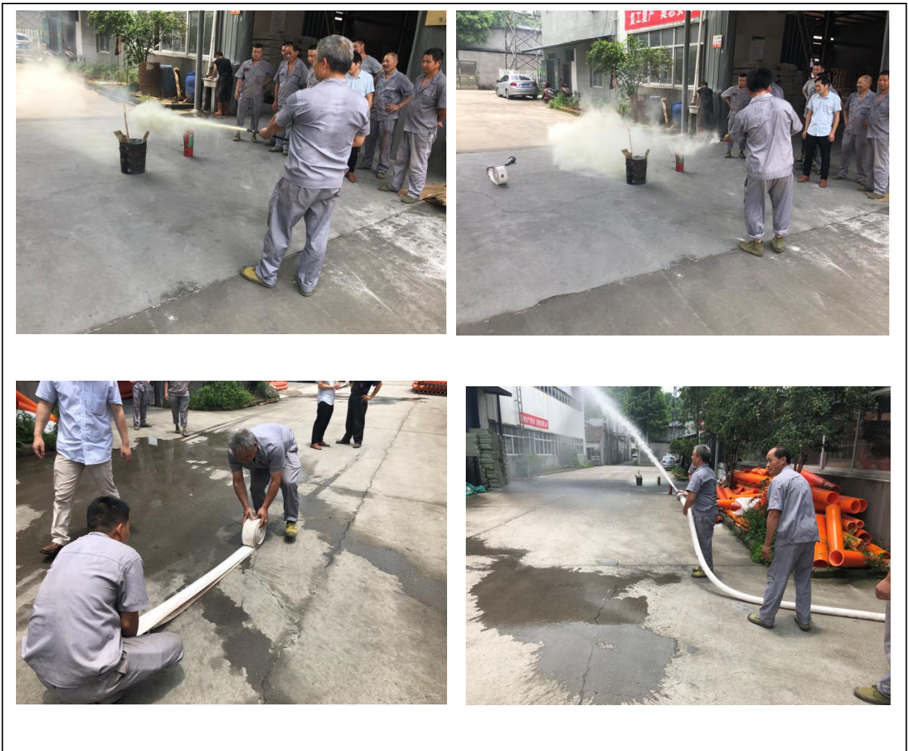
图 6.3-01 消防演练现场

公司每年举行消防演练和各种灾害应急演练。公司制订了《配电房火灾、爆炸应急预案》等应急预案、《触电事件应急预案》、《重大设备故障应急预案》等应急处置方案等，对火灾、机械、触电等均有相应的应急措施，并成立了应急指挥中心和应急救援专业组。